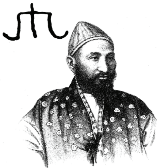
БҮЛҮЯ КОСТЬ САДЫКЪ БИРЪ КЕНИСАРЫ КАСИМОВА