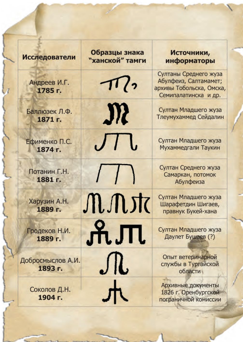
Рис. 1. Сравнительный анализ источников по тамгам джучидов конца XVIII – начала XX в. Составитель А. Е. Рогожинский. 2014 г.