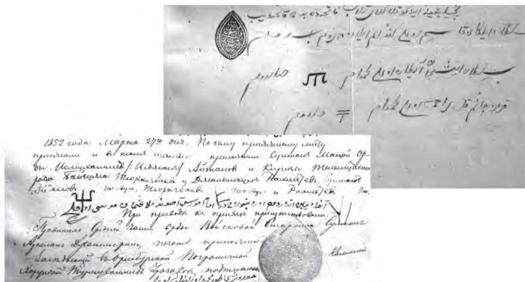
Рис. 5. Тамги султана Ишмухаммеда Айтанова на прошении о принятии российского подданства (вверху) и присяжном листе. 1852 г. ЦГА РК. Ф. 4. Оп. 1. Д. 416а. Л. 89, 99.